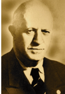
Vasil Kolarov war 1915 im Bernbiet und schmiedete da revolutionäre Pläne.

des Zaren stehende Tocheff. Aber: Auch Kolarov hatte in Genf studiert, und auch er wurde letztendlich bulgarischer Ministerpräsident (1949). Doch das Land war damals kein zaristisches mehr, sondern ein sozialistisches.