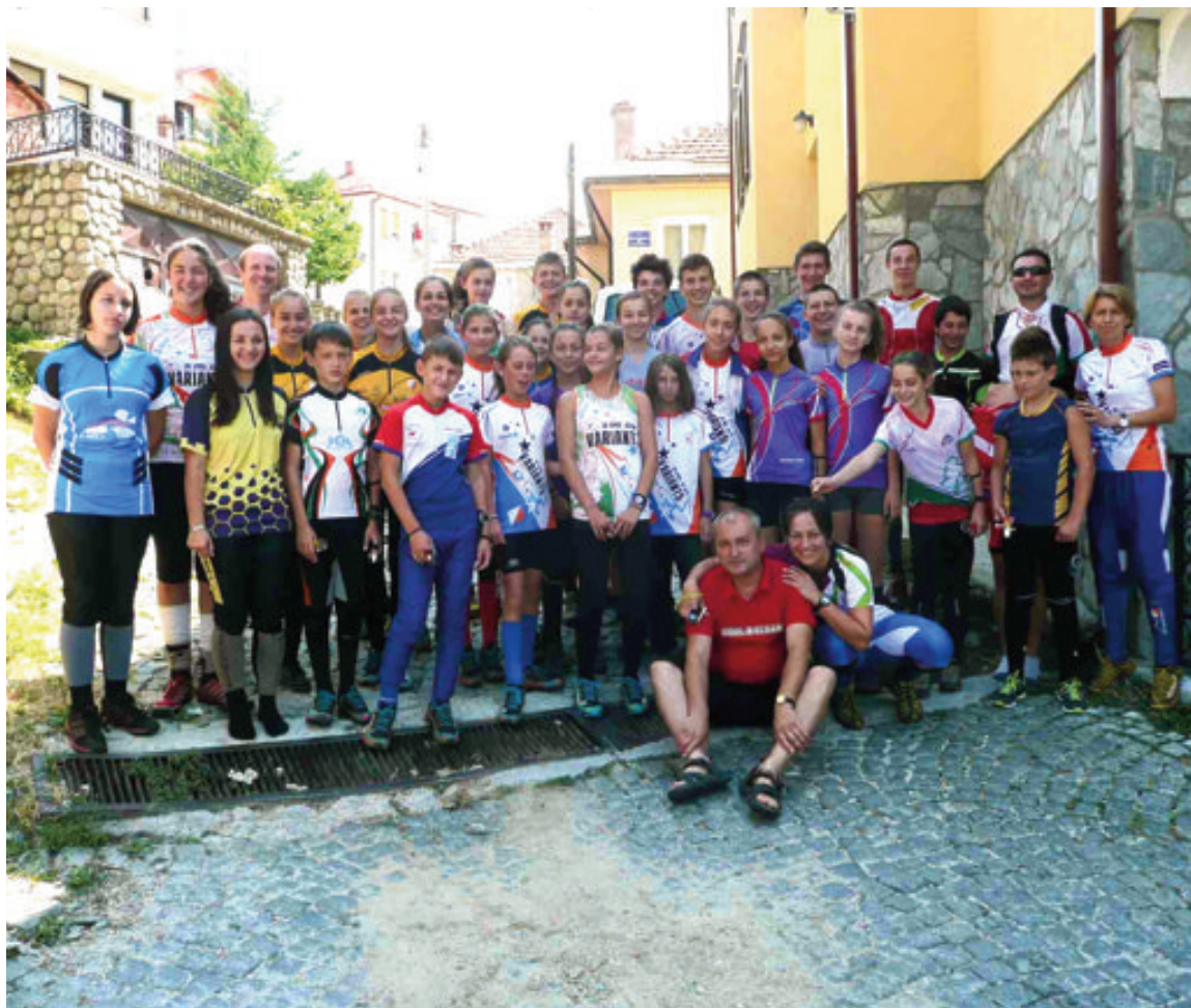
Austausch mit den Nachbarn: Das diesjährige Lager von «Variant 5» führte quer durch Südosteuropa.