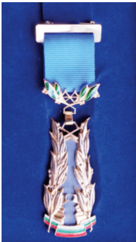
Der «Goldene Lorbeerzweig» ist die bedeutendste Auszeichnung, welche das Aussenministerium für Verdienste um das Land verleiht.