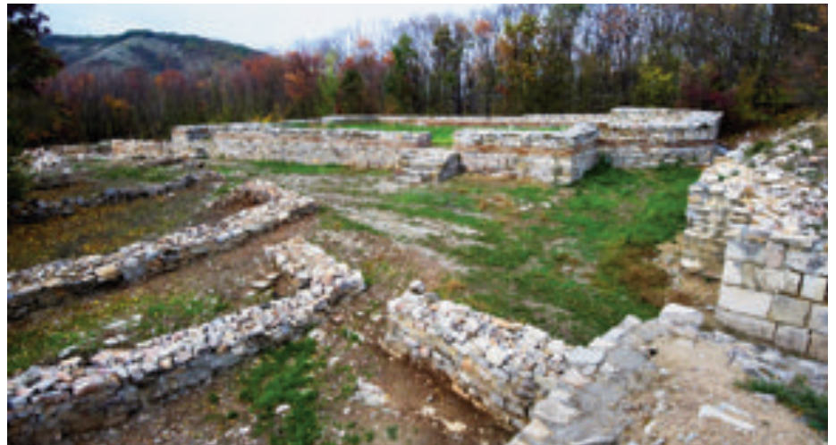
Die Ruinen des frühbyzantinischen Missionis bei Targoviste