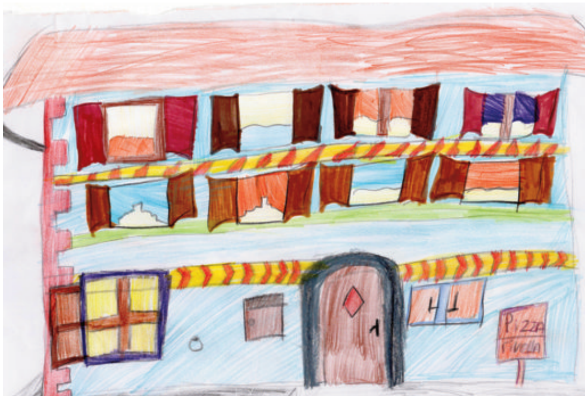
Wo steht dieses stattliche Haus mit seinen hübschen Sgraffiti und der Einladung zu Pizza und Rivella?

Förderverein «Variant Pet» p.a. Marc Lettau, Weiermattweg 15, CH-3098 Köniz, Schweiz. E-Mail-Adresse: info@variant5.ch Kontakt (CH): +41 79 226 13 27 +41 31 972 44 76 www.variant5.ch