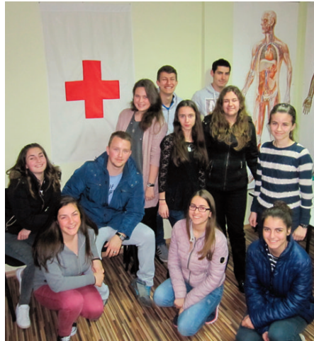
Freiwillige des Jungen Roten Kreuzes Targoviste in ihrem Theorielokal.

Das Projekt bietet auch elementare Gesundheits-erziehung – von Sucht- und Aidsprävention über den Schutz vor Übergriffen («mein Körper ge-