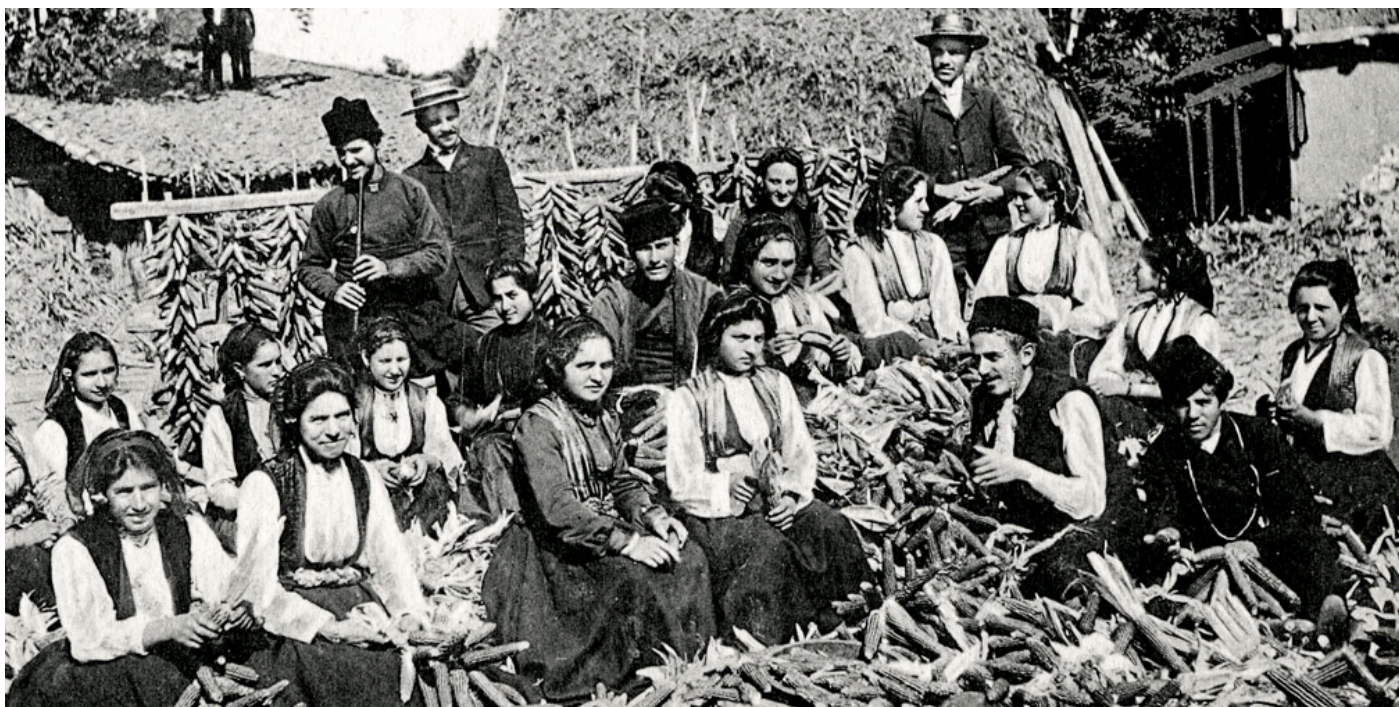
Sedjanka, historisch: Männer und Frauen entkörnen Mais an einer Sedjanka im Dorf Pirdop (um 1920).