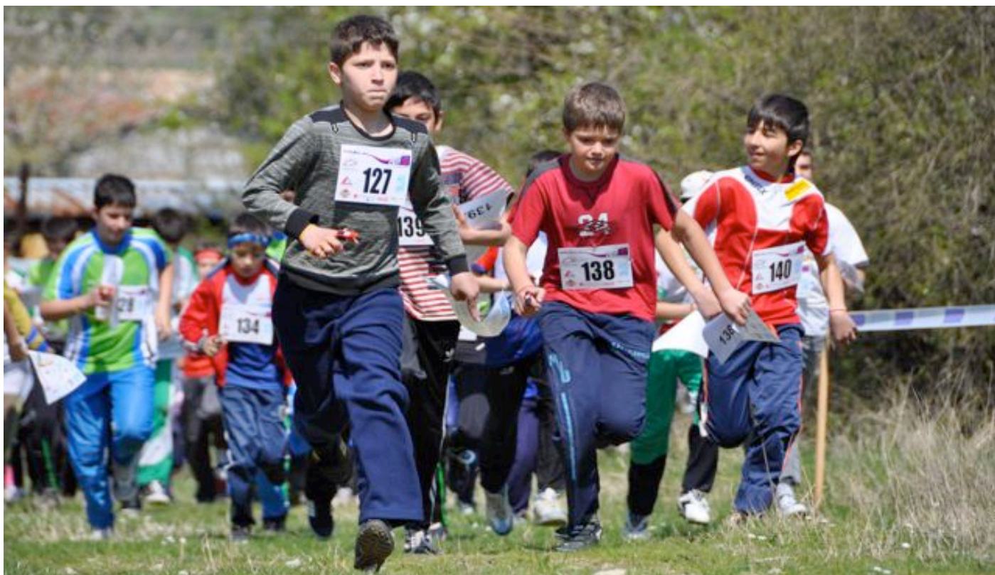
Bulgariens Jugend rennt durch den Wald – hier am «Cupa Velikden 2011» im Dorf Bajachevo bei Targoviste.