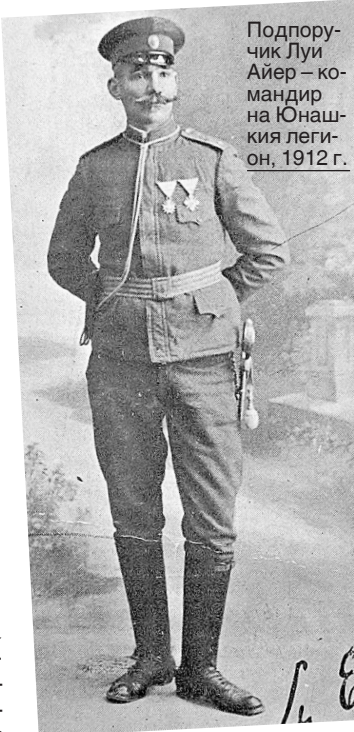
Подпоручик Луи Айер - командир на Юнашкото легион, 1912 г.