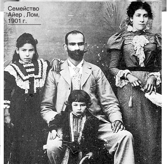
Семейство Айер, Лом, 1901 г.

то от края на 19 и началото на 20 век, спортното и военното обучение вървят ръка за ръка. Уроците по гимнастика са съчетани с маршировки, патриотични песни и балети със сюжети, почерпени от миналото на България. В условията на национален подем всички се готвят за бъдещото обединение на страната, което се очаква да дойде на върховете на щиковете.